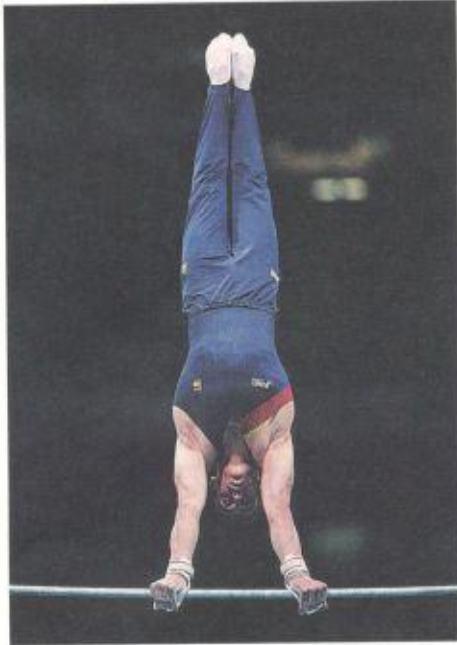
Jesús Carballo es un gimnasta español, campeón del mundo en la prueba de barra fija.

Además de su gran preparación física, es capaz de realizar acrobacias y ejercicios inventados por él, y que, por tanto, son únicos.