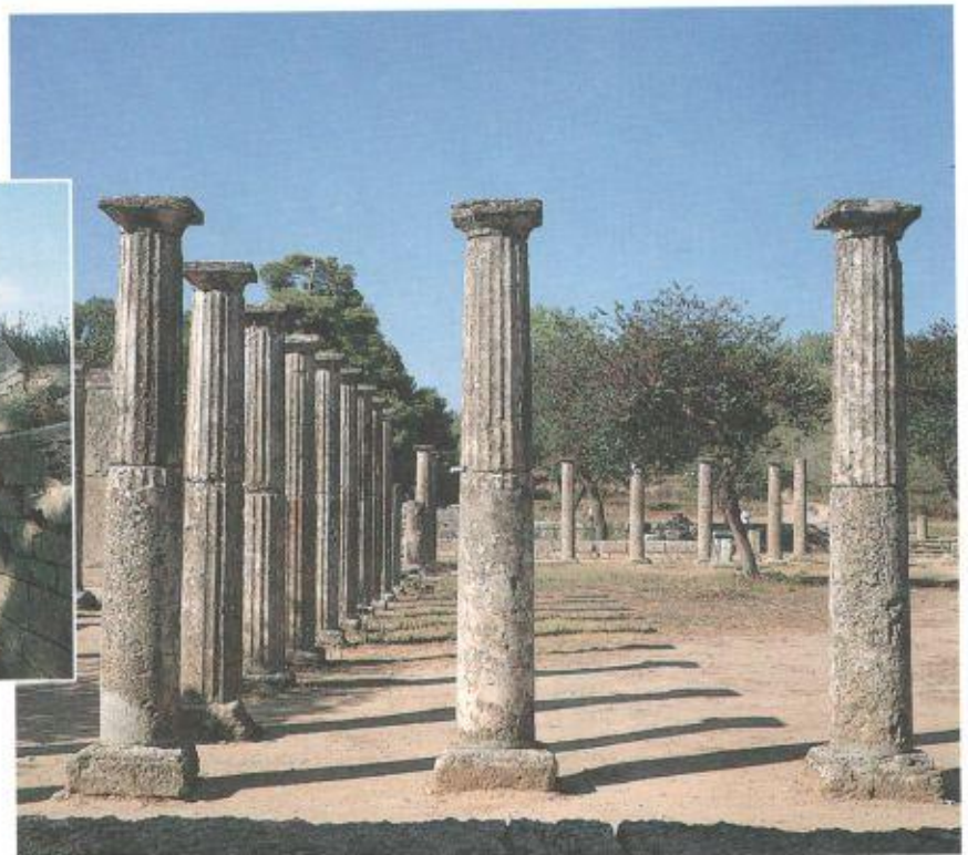
Ruinas de un gimnasio, Olimpia.