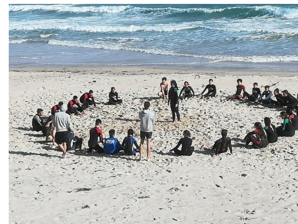
Viaje fin de etapa 4º ESO junio 2019